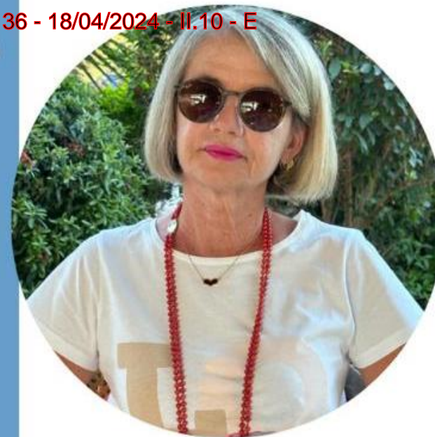
Michela Acconci Scuola Primaria

Ecco il perché della mia candidatura e la scelta di questo Sindacato che ha fatto proprie le lotte per una SCUOLA DEMOCRATICA, LIBERA che sappia dare dignità' alla professione degli insegnanti e che passi anche da una " giusta" riqualificazione economica.